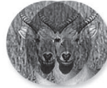
un solo campo circular